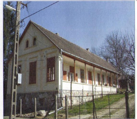
Ein frisch renoviertes Bauernhaus

Alltag bewältigte. Zwar ist im Themenpark von den Ungarndeutschen nichts zu sehen, denn die Ansiedlung fand ja erst nach der Renaissance statt, doch viele Ungarndeutsche fanden eine Arbeit auf dem Mittelalterspiel-