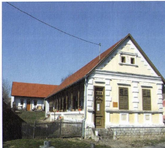
Das Heimatmuseum von Bikal

Zahlreiche herkömmliche schwäbische Bauernhäuser zieren das Dorf, durch das Interesse für die Gemeinde beflügelt kaufen und renovieren junge Leute die alten Höfe. Auch das schicke Heimatmuseum von Bikal zeigt den Touristen, welche Volksgruppe hier lebt und wie sie einst ihren